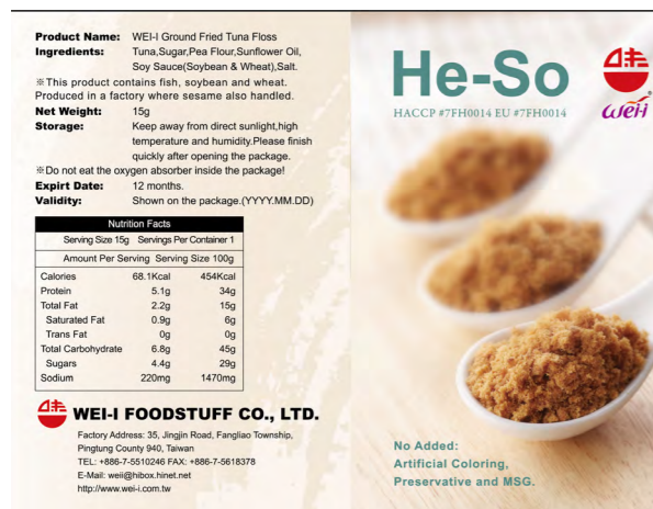
圖 1. 設計圖稿

於產品包裝中，以創新設計的可體驗或可攜式商品樣式，吸引國際食品展中的新客戶。設計圖稿如下所示。